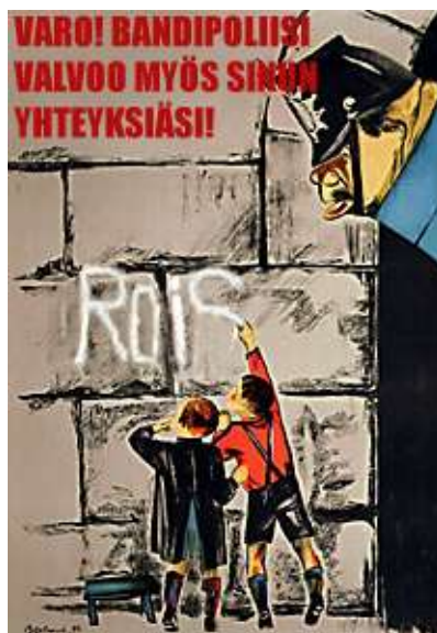
Valvonnan lisääminen tulee nosta- maan kiinnijäämisriskiä.

Lisäksi kokouksessa käsiteltiin liiton hallinnon ja tilaisuuksien tulevaisuutta. Selkeänä ohjenuorana haluttiin liiton johto täyttää sotilashenkilöillä, jolloin esimerkiksi "Ensimmäinen Uusi Kesäleiri" voidaan koostaa useista pienistä leireistä. Jokainen pieni leiri käsittelee oman alansa asioita, kuten DX-toimintaa, kilpailutoimintaa tai satelliittivorkkimista. Nämä leirit kootaan yhdelle alueelle suureksi keskityskesäleiriksi, jonka järjestystä ja sisään- ja ulospääsyä sotilaspoliisit vartioivat.