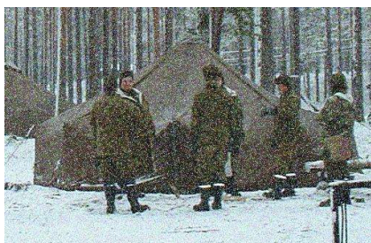
Sotilasjuntalla oli välillä aikaa pitää taukoakin.

Vaikka nykyinen tilanne on epävarma, olen saanut varmoilta lähteiltä kuulla tarkkoja suunnitelmia Suomen Radioamatööri-liiton tulevaisuudesta. Lähteiden tarkoitusperiä en voi kuin arvailla, mutta taustalla vaikuttaa jo tunnetuksi tulleet hevostmiehet.