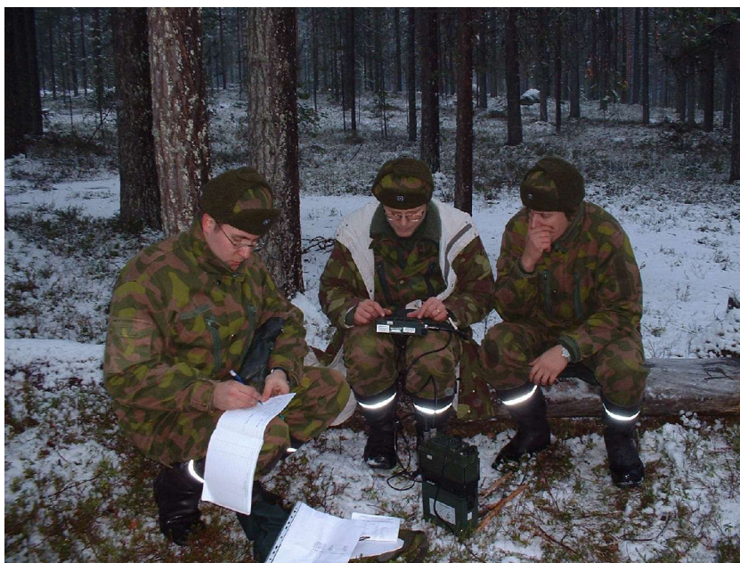
Lavastettu kuva Syysottelusta 2005. Operaattori workkii, toinen pitää lokia. Kolmas henkilö on CCF:n nimittämä Oikeamielinen Valvoja, jollainen on oltava jokaisella asemalla. . Tässäkö tulevaisuutemme todella on? Huom! Vain keskimääräinen on radioamatööri (oh6kxl)

Kokouksessa oli mukana myös liiton aivan ylintä johtoa, jotka ovat mukana salaliitossa. Kokouksen tunnelmissa perehdyttiin mm. radioamatööritoiminnan siirtämistä hyppivätaajuiseksi työskentelyksi ja kone-maiseksi, vocoderitekniikalla