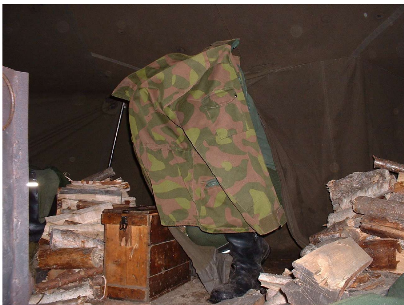
Sotilasjuntan jäsen naamioituu saapuessaan kokoukseen. Kaikki epäilevät kaikkia.

Uuden valtajoukon ydin, ns. Srelan mafia, kokoontui tarkasti vartioidussa paikassa muodostamassa pitkäjänteisiä tulevaisuudensuunnitelmia liiton ja radioamatööritoiminnan tulevaisuuden suunnittelemiseksi.