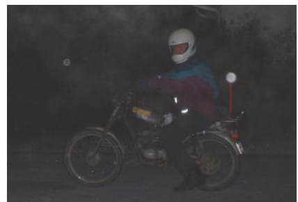
Custom-Raisu vm-84 ja ylpeä kuljettaja ajoasusaan kääntää päät.